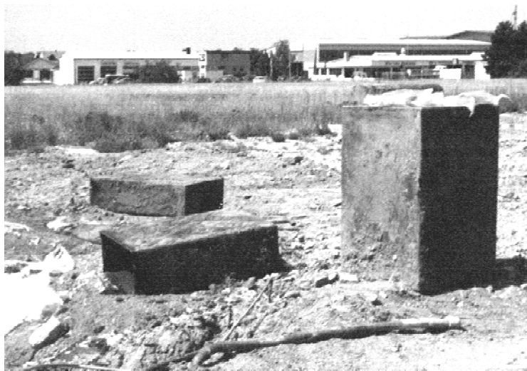
Abb. 2 Fotografie von drei Tanks (500 bis 1000 l), die durch die Geomagnetik detektiert und danach geborgen wurden.

Messung, Auswertung, Bericht: 1 bis 2 TEur