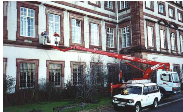
Abb. 1 Meßwertaufnahme mit Radar