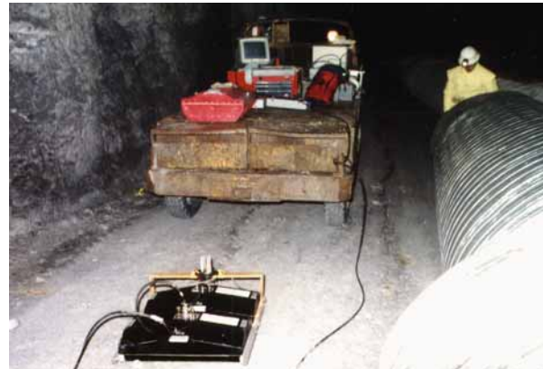
Abb. 1 Während der Messung auf der Stollensohle. Im Vordergrund ein 180 MHz-Hochleistungssender und ein 180 MHz-Empfänger für bistatische Messungen mit variablem Abstand von Sender und Empfänger.

Messung 4 mal 500 m, Auswertung, Bericht: 2 T€