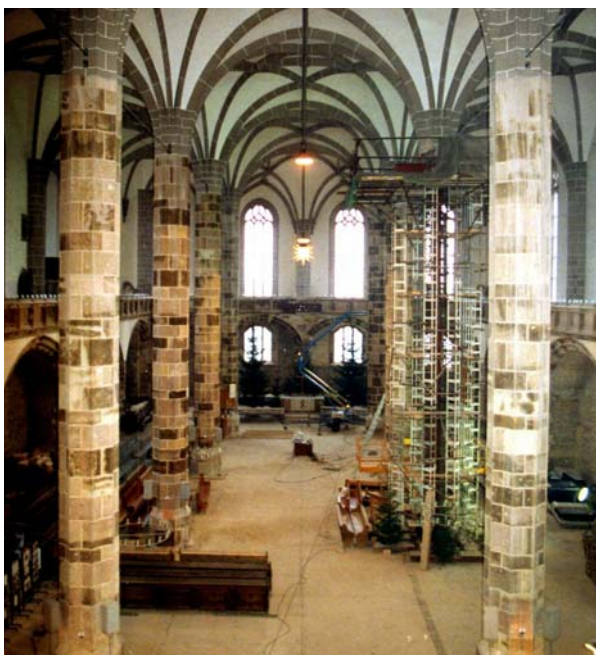
Abb. 1 Foto des Mittelschiffs mit Pfeilern

Die Prüfung erfolgte über eine Hebebühne entlang von vertikalen Meßlinien. Dies erlaubte eine zügige Messung.